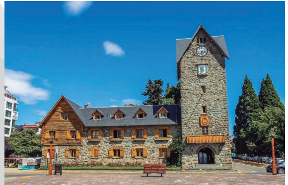
BARILOCHE CENTRO CIVICO