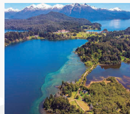
LAGO NAHUEL HUAPI